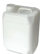
BIDON 5L 10L 20L