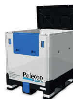
PALECON TNT 1000L