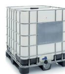
IBC CONTAINER 1000L