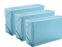
CARTONLESS 4X2,5KG 10KG 12,5KG 20KG