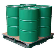
VATEN 4X200KG 1X10KG